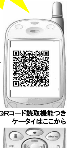
↑QRコード読取機能つき ケータイはここから