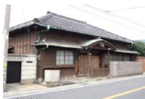
加藤邸 (4丁目バス停横)