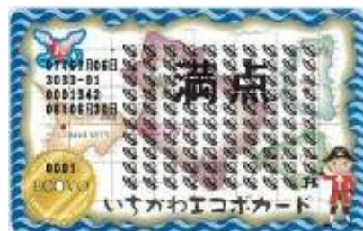
エコボ満点カード