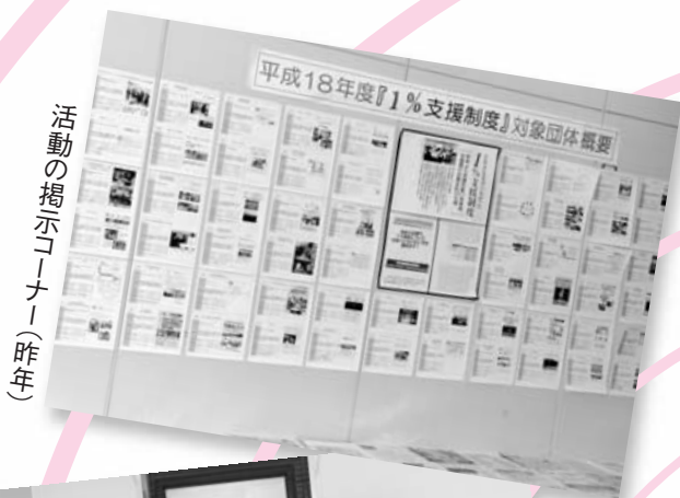
活動の掲示コーナー(昨年)

今年、85団体から応募があり、3月に開かれた市民活動団体支援制度審査会(学識経験者4人、公募市民3人)の審査を通過した85団体が支援対象団体となりました。本紙4面に、すべての団体を分野別の二覧表にして、団体名、事業名、希望支援額(事業費の2分の1が上限)などをまとめました。団体ごとの活動PRは、5面から13面に活動分野別に掲載しています。団体が創意工夫を凝らした活動PRの原稿をそのまま載せており、市民活動ならではの多彩な内容となっています。ぜひご覧いただき、支援したい団体を選んでください。