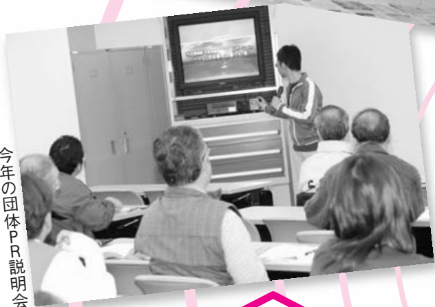
今年の団体PR説明会